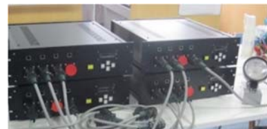
電力をバケット化して送受信するルータ