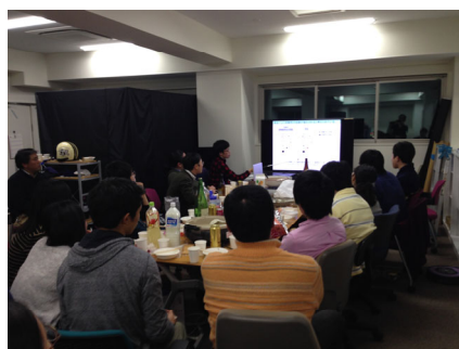
研究室でのセミナー風景 (現在は、オンライン参加も併用)