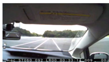
自動車運転中の認知・操作の計測実験の画像