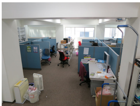
院生研究室の様子