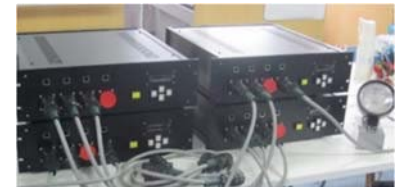
電力をパケット化して送受信するルータ